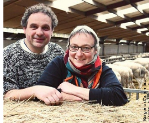
Bergerie d'Acremont

Chaussée de Dinant 1037 • 5100 Wépion +32 (0) 81 46 20 07 www.museedelafraise.com