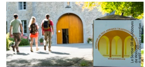
Le Sentier GR des Abbayes Trappistes de Wallonie

Orval 1 • 6823 Villers-devant-Orval (Florenville) +32 (0) 61 31 10 60 • www.orval.be