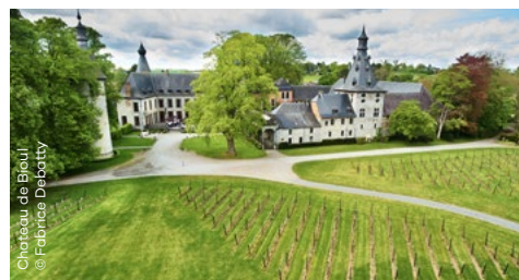
Château de Bioul

Place Vaxelaire 1 • 5537 Bioul (Anhée) +32 (0) 71 79 99 43 www.chateaubioul.be