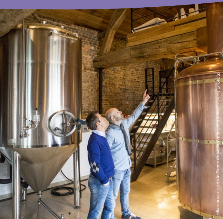
Microbrasserie de la Ferme de Mont-Saint-Jean