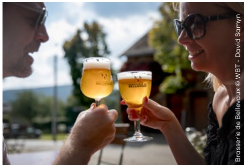
Brasserie de Bellevaux