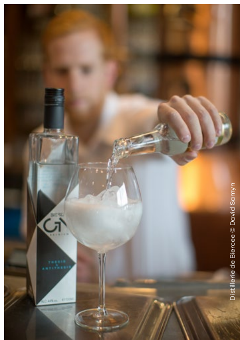
Distillerie de Biercée

Spécialités: Eau de Villée, Poire Williams N°1, P'tit Peket