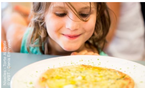
Nivelles - Tarte Al Djote