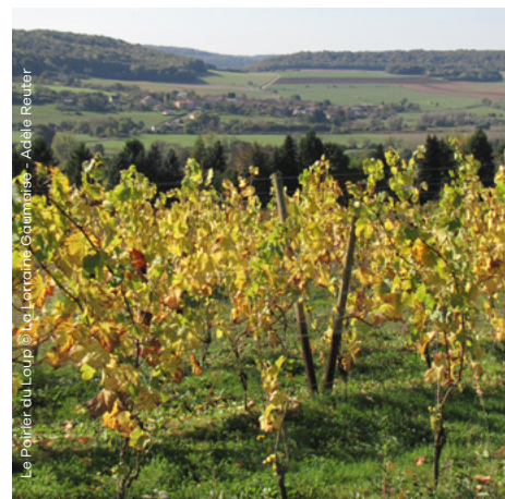
Le Poirier du Loup

Rue du Village 36 5555 Bellefontaine (Bièvre) +32 (0) 478 77 82 57 www.vignobledebellefontaine.be