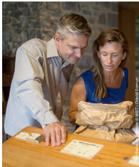
Distillerie de Biercée

Chemin d'Harmignies 1 7120 Haulchin (Estinnes) info@ruffus.be www.ruffus.be