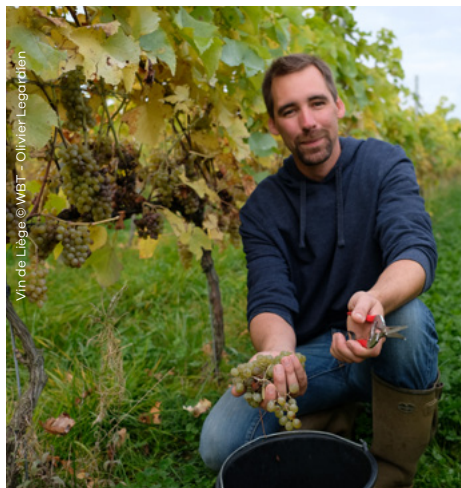
Vin de Liège