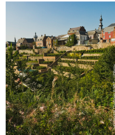
Le Vignoble thudinien

Rue Emile Vandervelde 3 7332 Sirault (Saint-Ghislain) +32 (0) 478 22 45 26 Le-Vignoble-de-Sirault