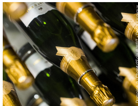
Domaine du Chant d'Eole

Rue Quartier du Pont 35 7100 Trivières (La Louvière) +32 (0) 473 56 60 29 www.moulinduloup.be