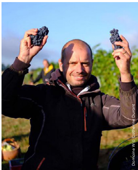
Domaine W

Rue de l'Abbaye 55 • 1495 Villers-la-Ville +32 (0) 71 88 09 80 www.villers-la-vigne.be