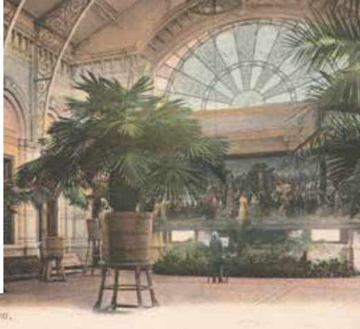
Spa. - Intérieur du Pouchou.