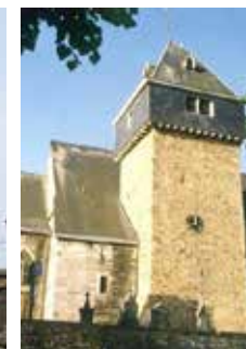
Eglise Saints Hermès et Alexandre Theux