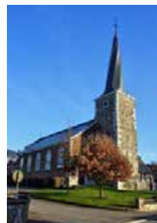
Eglise Saint Michel Jalhay