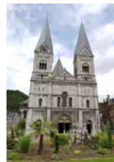
Eglise Saint Remacle Spa